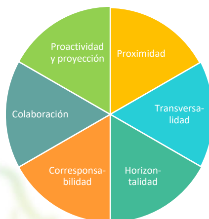
Figura I Principios orientadores determinantes de las redes educativas

Fuente: Elaboración propia, con base a Civís y Longás (2015)