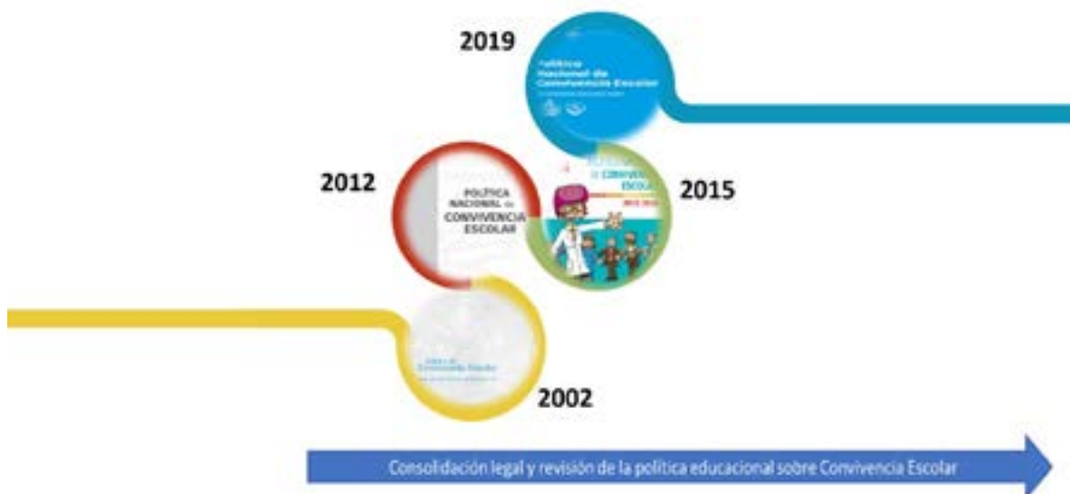
Figura N°1 Actualización Política Nacional de Convivencia Escolar

Hasta el momento se han redactado cuatro versiones de la PNCE, atendiendo a las transformaciones sociales, las reformas educativas y la normativa legal que se ha ido construyendo durante este periodo en Chile.