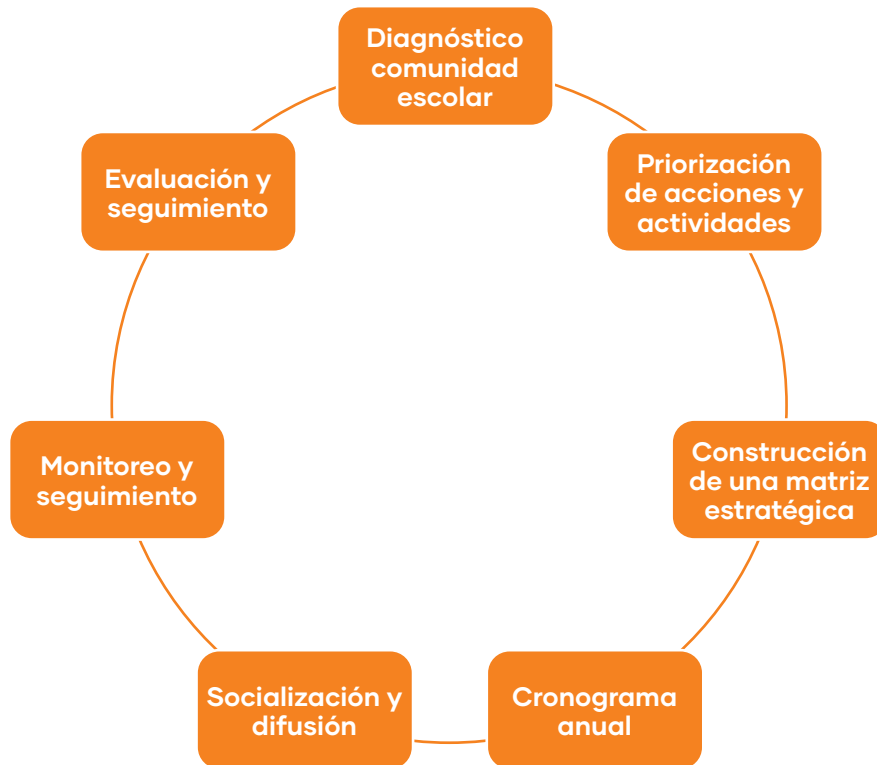
Figura N°3 Fases de construcción del PGCE

“Gran parte de la capacidad de adaptarse a los cambios radica en la disponibilidad y uso de información que permita adoptar decisiones fundamentadas y oportunas, ya sea para introducir cambios, reorientar procesos, redistribuir recursos, lo que implica la necesidad de recolección de información de forma permanente, para ir monitoreando las condiciones en que se desarrolla el proceso educativo” (División de Educación General, 2021).