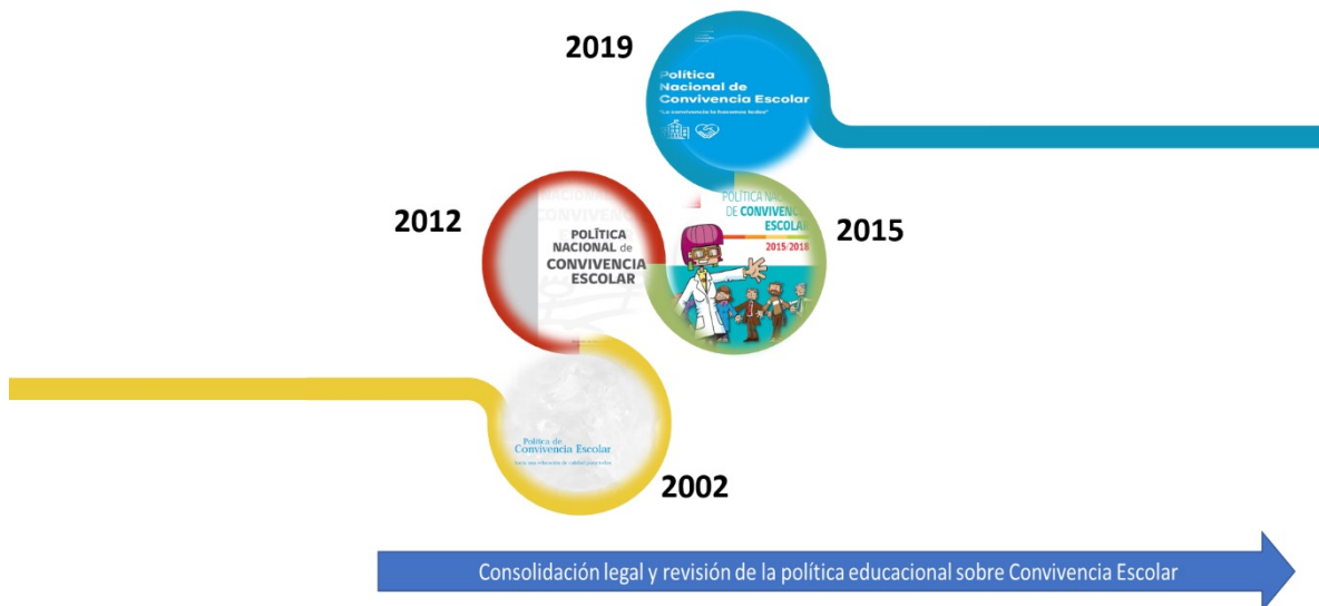
Figura N°1 Actualización Política Nacional de Convivencia Escolar

Hasta el momento se han redactado cuatro versiones de la PNCE, atendiendo a las transformaciones sociales, las reformas educativas y la normativa legal que se ha ido construyendo durante este periodo en Chile.