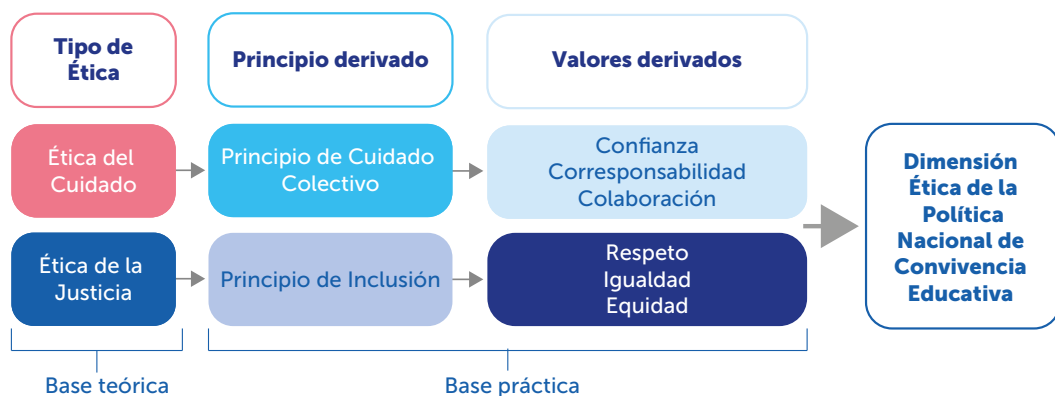
FIGURA 3. DIMENSIÓN ÉTICA DE LA POLÍTICA NACIONAL DE CONVIVENCIA EDUCATIVA