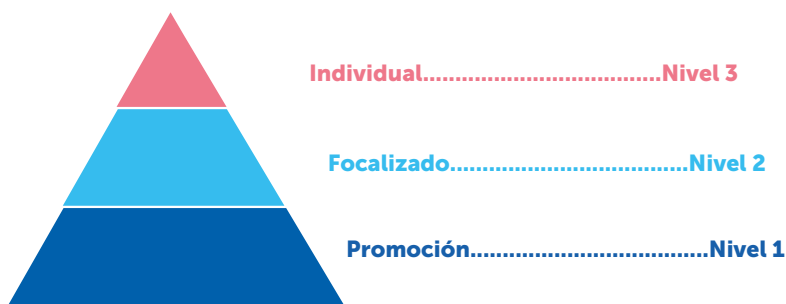
FIGURA 4. MODELO DE ESCUELA TOTAL MULTINIVEL